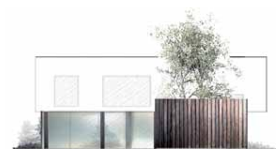
ELEWACJA BOCZNA: górna kondygnacja to usytuowane nad przestronnym salonem sypialnie i duży pokój kąpielowy