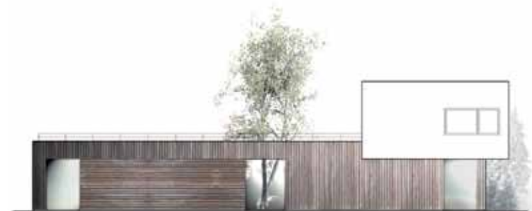
ELEWACJA FRONTOWA: nachodzące na siebie kubiki dzielą dom wizualnie i funkcjonalnie na część dzienną i prywatną