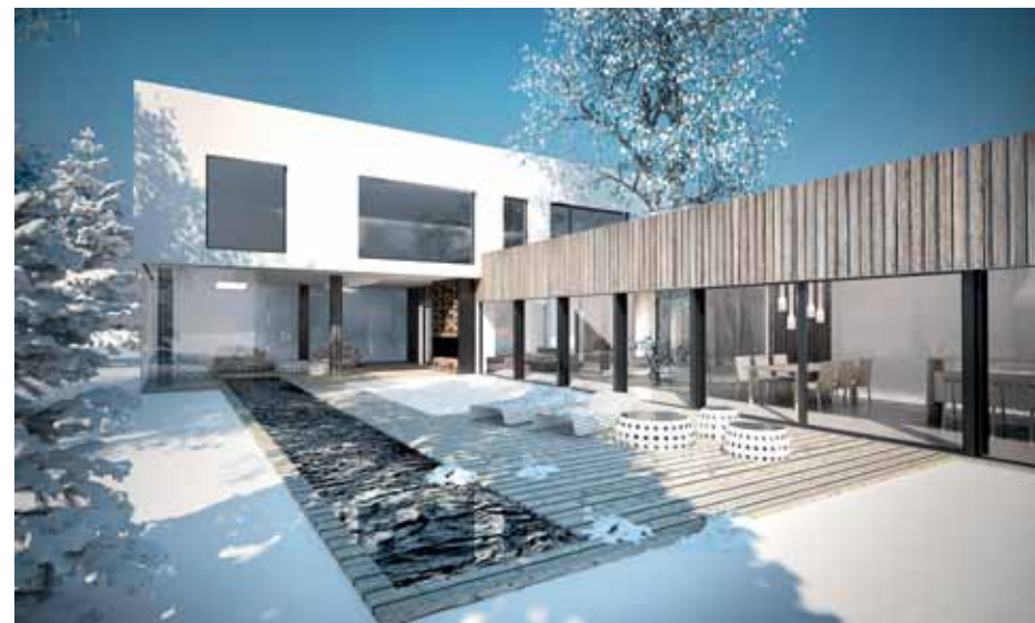
PŁYTKI ZBIORNIK WODNY zimą łączy ogród zimowy z drugim tarasem, a latem jest ochłodą podczas słonecznego relaksu

Elewacje domu pokryte zostały litym drewnem, które z biegiem lat będzie się zmieniać, zyskując na szlachetności. Dwa tarasy łączy ze sobą płytki zbiornik wodny. Tafla okien w części kuchennej rozsuwają się na całej szerokości jednego z nich. Latem dzięki temu można na nim urządzić jadalnię. Drugi taras został obudowany przesuwными szklanymi panelami. W zimie pełni funkcję ogrodu zimowego.