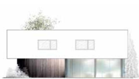
ELEWACJA BOCZNA: za przeszklonymi panelami znajduje się taras, który zimą jest zamykany, a latem otwierany na ogród