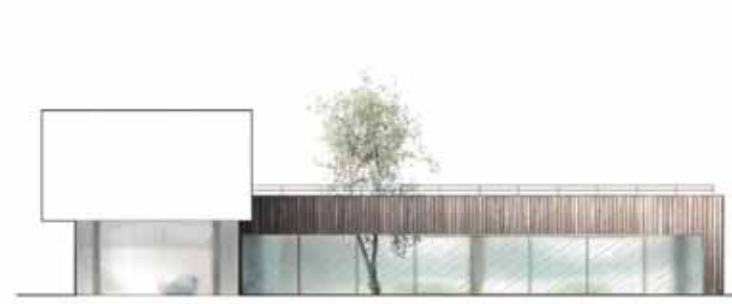
ELEWACJA OGRODOWA: duży taras na dachu pełni funkcję nie tylko ogrodu, ale też punktu widokowego, z którego można podziwiać otaczający krajobraz