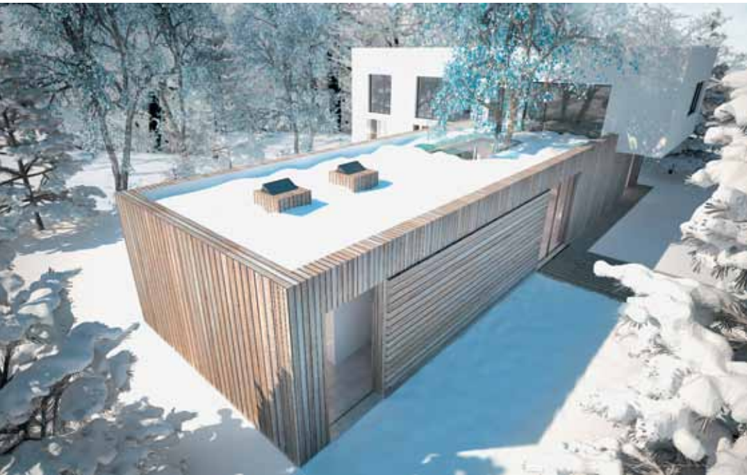
ELEWACJE POKRYTE LITYM DREWNIEM sprawiają, że budynek pozostaje w symbiozie z lasem